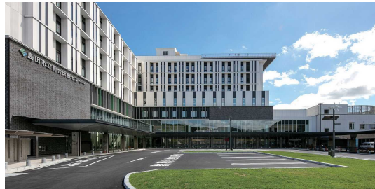
(令和5年3月グランドオープン)