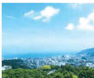
風光明媚な伊東市