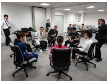
初期研修医との意見交換会