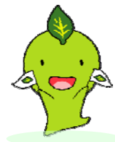
生きがいと健康づくり イメージキャラクター 「ちゃっぴー」