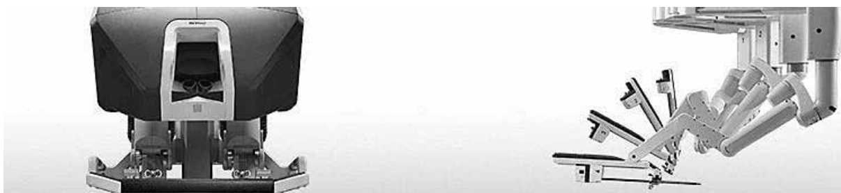
(米国 Intuitive Surgical 社製「da Vinci Xi Surgical System」： 浜松医科大学)