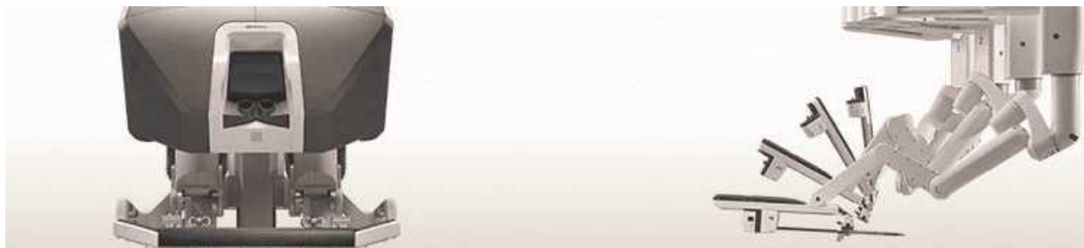
(米国 Intuitive Surgical 社製「da Vinci Xi Surgical System」：浜松医科大学)